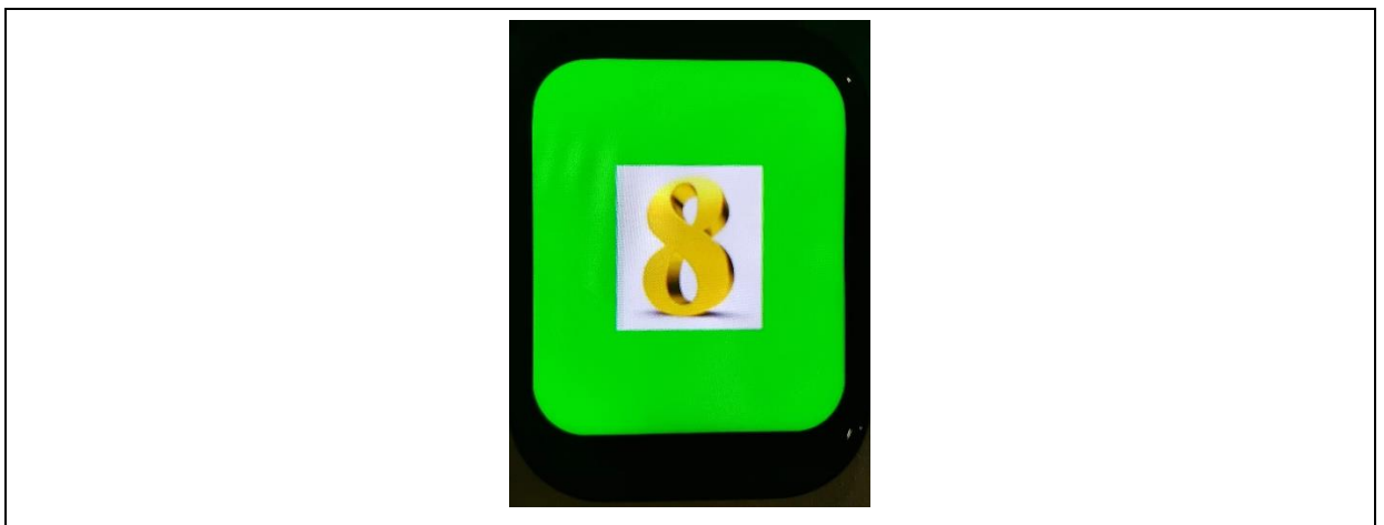
图 3. 显示图片