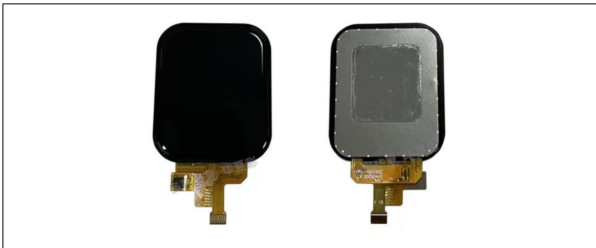
图 2. 触摸屏